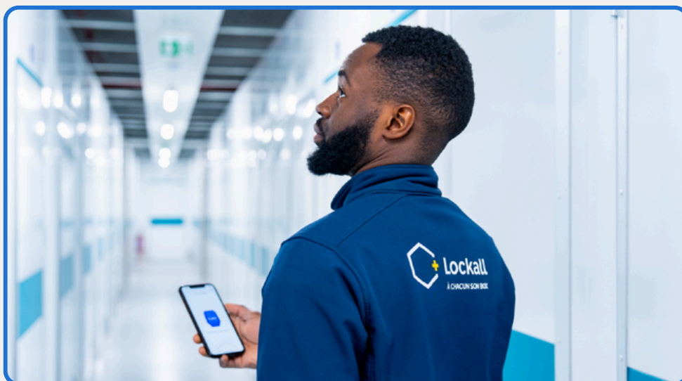
Gestion fluide des installations avec l'application One Access

La solution intelligente de Sensorberg est hautement évolutive, permettant à Lockall d'étendre ses services et d'ajouter davantage d'unités sans modifications importantes de l'infrastructure. Cette flexibilité a été essentielle pour la stratégie de croissance de Lockall.